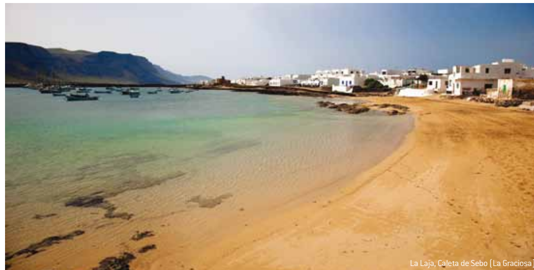
La Laja, Caleta de Sebo (La Graciosa)