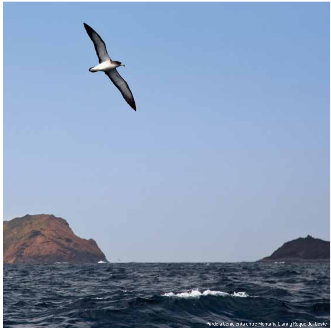
Pardela Cenicienta entre Montaña Clara y Roque del Oeste