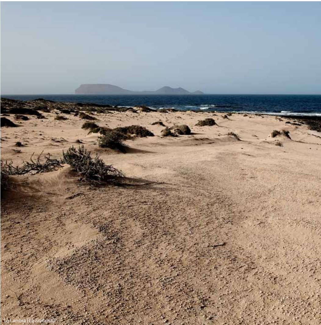
La Lambra (La Graciosa)