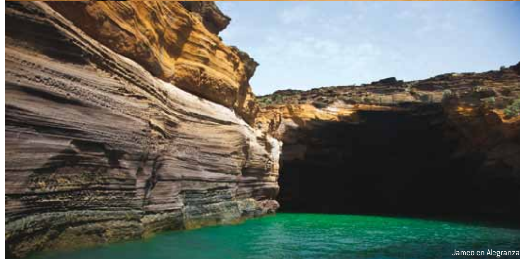
Jameo en Alegranza