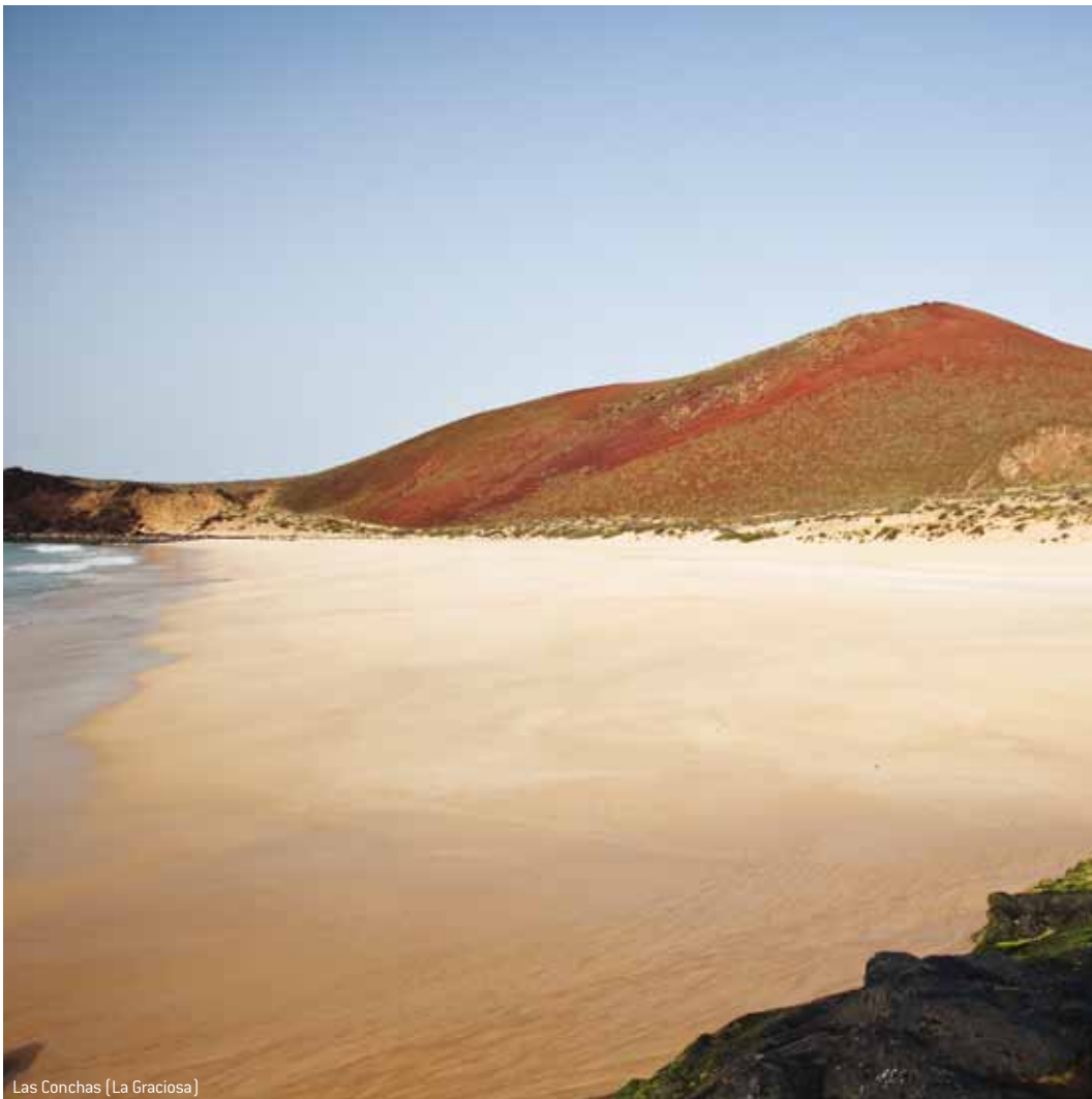
Las Conchas (La Graciosa)