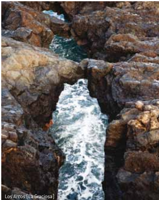
Los Arcos (La Graciosa)

personas autorizadas por las administraciones pesqueras. La reserva cuenta con una excelente riqueza natural donde abundan peces como la vieja, sama, salemas, meros, abades,... y más de 300 especies de macroalgas, albergando la mayor biodiversidad marina de Canarias. Estos recursos explican la abundancia de aves marinas y por eso también ha sido declarada Zona Especial de Protección para las Aves. Aquí se encuentra una de las poblaciones más numerosas de Europa de la pardela cenicienta y entre las especies más raras y amenazadas está el paíño pechialbo y también cernícalos, lechuzas, el halcón de Eleonor y el guincho o águila pescadora. Sin duda, un lugar ideal para su cría y reproducción bajo la responsable protección del hombre.